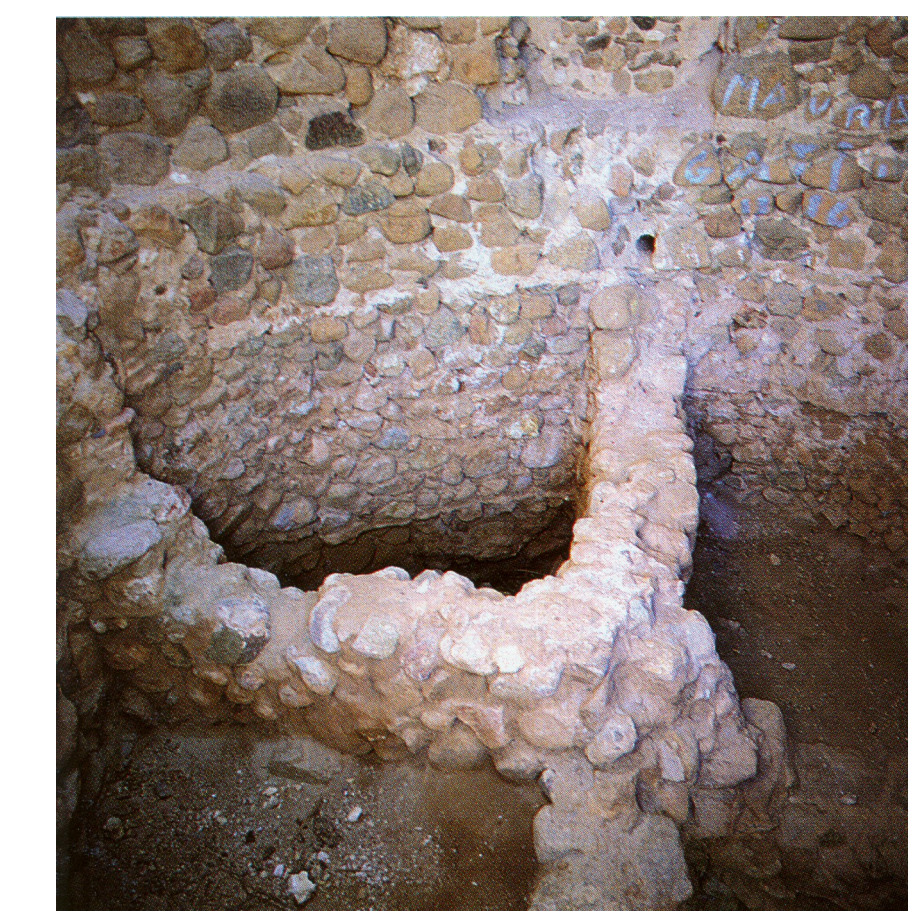
Particolare della struttura di irrigidimento della fondazione, con doppio contrafforte interno intersecato a croce