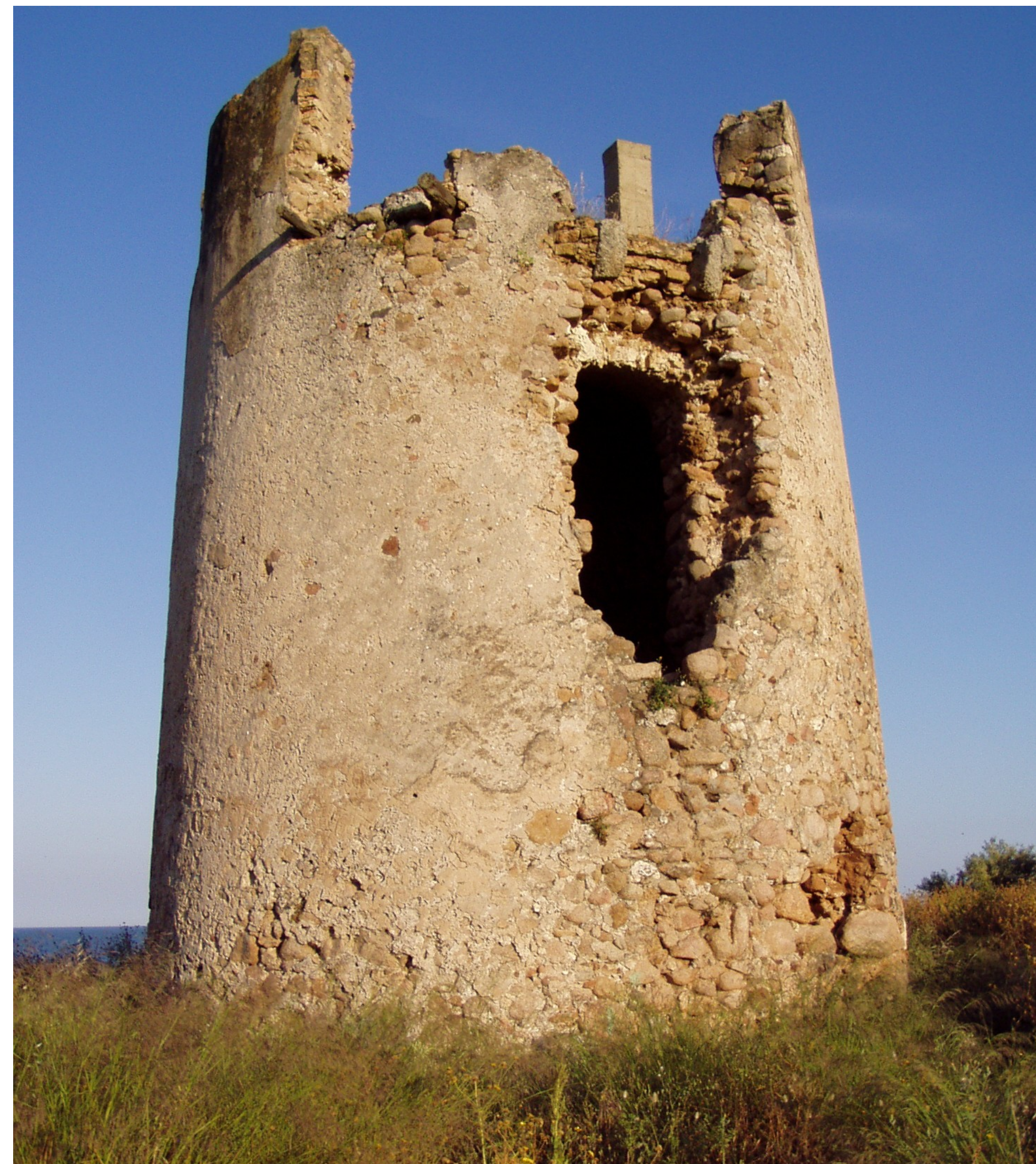
La Torre di Su Loi Nella frattura del muro è visibile il particolare costruttivo dell'opera "a cassetta" o "a sacco"