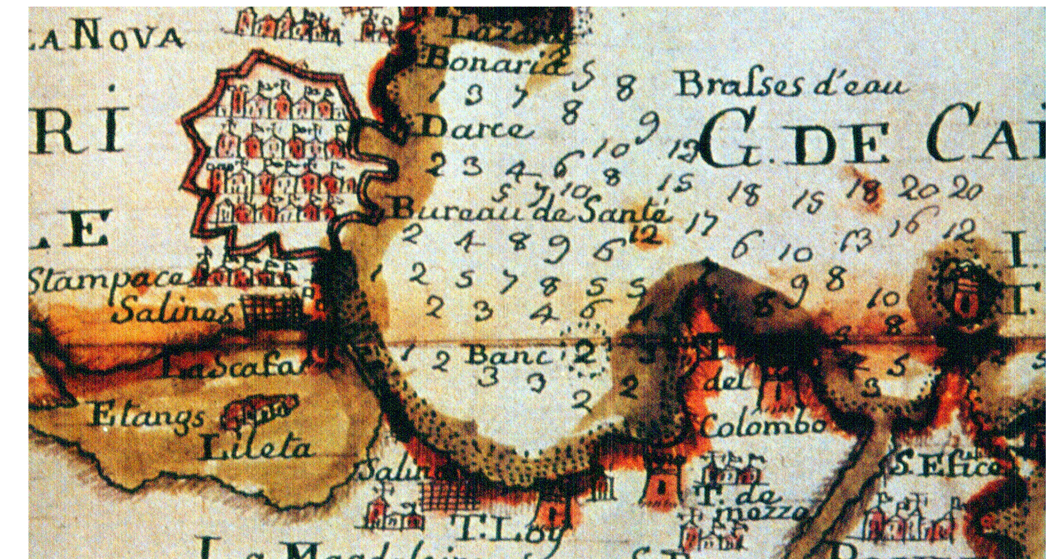
Particolare del Golfo di Cagliari, tratto dalla Carta della Sardegna di François Giaume (1813) - Archivio di Stato di Torino Sono visibili le torri di Su Loi, Antigori (Torre di Mezzo) e del Diavolo (Torre del Colombo)