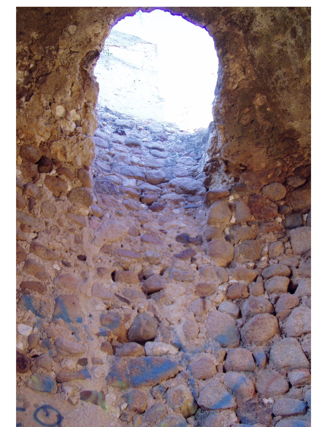
Particolare della botola di accesso al terrazzo